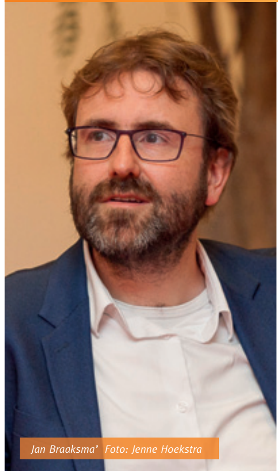
Jan Braaksma'

Hiervoor zijn bedrijven, die al extra geïnvesteerd hebben in onderhoud, nu in het voordeel en hebben daarmee al een beter inzicht in hun kapitaalgoederen. Deze organisaties kunnen nu beter onder-